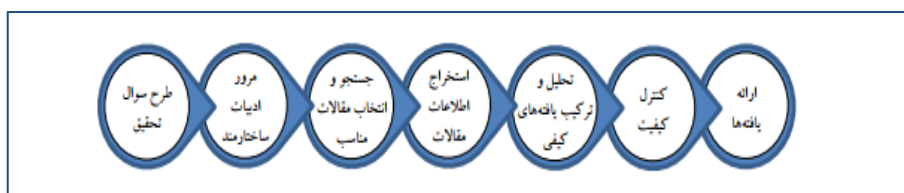
شکل ۱. گام‌های روش فراترکیب (سندلوسکی و باروسو، ۲۰۰۷).

اصولا پژوهش‌های حوزه علوم اجتماعی یا از روش مراجعه به منابع دست اول نظیر مصاحبه، پرسشنامه یا مشاهده انجام می‌شوند، یا اینکه منابع ثانویه داده‌ها نظیر کتب، مقالات و مستندات مبنای پژوهش قرار می‌گیرند. بر این اساس با توجه به اینکه پژوهش حاضر به منظور ساماندهی و بهره‌برداری از دانش موجود و شناخت خلاءهای پژوهشی در مطالعات گذشته از طریق تحلیل نظام‌مند متون انجام شده است آن را می‌توان از نوع ثانویه دانست. در واقع پژوهش حاضر از نظر هدف بنیادین و از لحاظ ماهیت داده‌ها و سبک تحلیل جزو پژوهش‌های کیفی به شمار می‌رود که در آن داده‌های پژوهش با استفاده از روش فراترکیب ۱ جمع‌آوری و تحلیل شده است. فراترکیب نوعی مطالعه کیفی است که اطلاعات و یافته‌های استخراج شده از مطالعات کیفی دیگر با موضوع مرتبط و مشابه را بررسی می‌کند و با فراهم کردن نگرشی نظام‌مند برای محققان از طریق تلفیق پژوهش‌های کیفی مختلف به کشف موضوعات و استعاره‌های نوین می‌پردازد، دانش جاری را ارتقاء داده و نگرش جامعی نسبت به مسائل ایجاد می‌کند. رایج‌ترین الگوهای مورد استفاده برای روش فراترکیب الگوی سه مرحله‌ای نوبلت و هیر ۲ (۱۹۸۸)، الگوی شش مرحله‌ای والش و داون ۳ (۲۰۰۵) و الگوی هفت مرحله‌ای سندلوسکی و باروسو ۴ (۲۰۰۷) است. در پژوهش حاضر از روش هفت مرحله‌ای سندلوسکی و باروسو ۴ (۲۰۰۷) استفاده شد که مراحل آن در شکل ۱ مشاهده می‌شود.